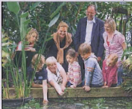
Von der Natur kann die Technik noch viel lernen.